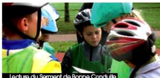
Lecture du Serment de Bonne Conduite

éducative 2008 ». Aujourd'hui, le pouvoir « socio-éducatif » du concept a été transposé dans de nombreux contextes : Plusieurs formations BPJEPS (Brevet d'état Jeunesse et Sports) l'ont utilisé dans ce sens ; la BPDJ (Brigade de Prévention de la Délinquance Juvenile) de la Gendarmerie de Sochaux a été partenaire d'une manifestation ; des Magistrats nous ont contactés pour travailler ensemble.... A l'heure où l'interministérialité est à la mode, le RollerFootball® se présente réellement comme une vitrine interministérielle car ce jeu n'est pas un « sport guerrier » et son unique objectif est de créer du lien social et de la rencontre.