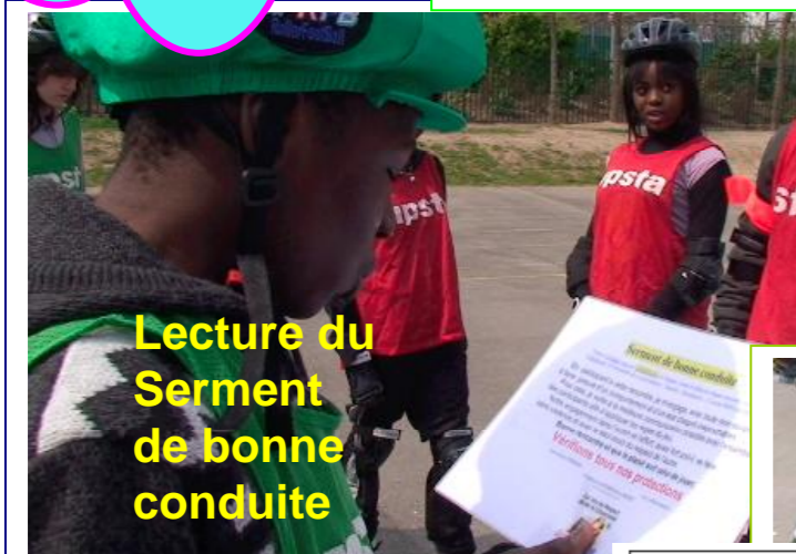
Lecture du Serment de bonne conduite